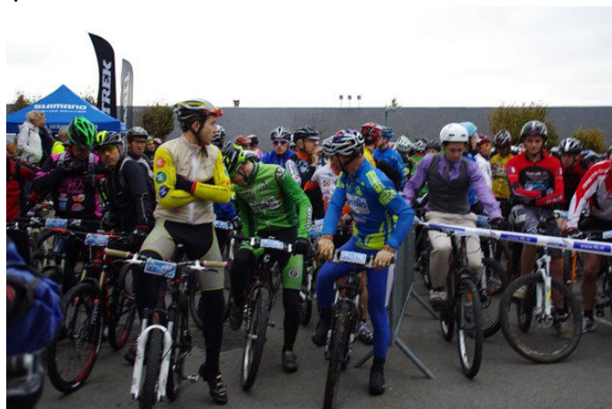
(La photo est le départ de 2019)